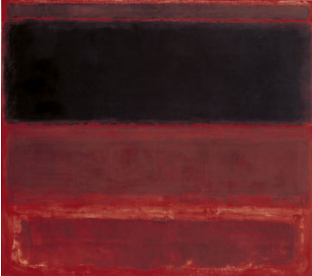
Mark Rothko, Four Darks in Red , 1958, Whitney Museum of American Art