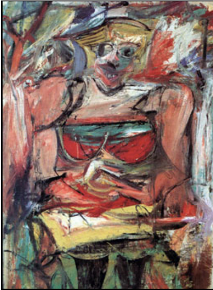
Willem de Kooning, Woman V (1952–53), National Gallery of Australia