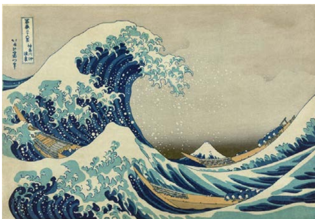
Hokusai, The Great Wave off Kanagawa , 1830-1833, The Metropolitan Museum of Art