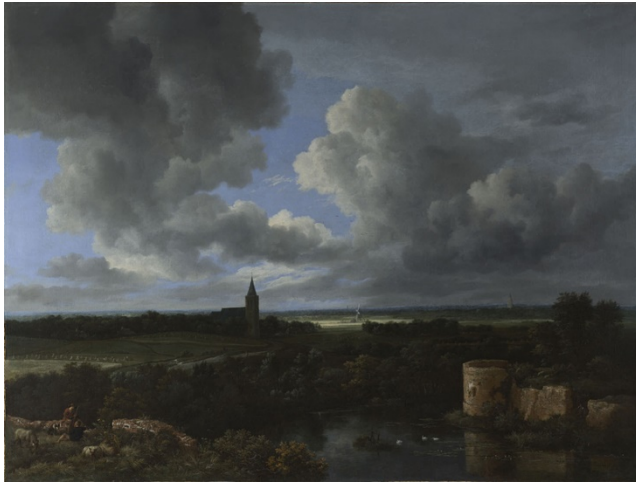
Jacob van Ruisdael, A Landscape with a Ruined Castle and a Church , 1665-70, National Gallery (UK)