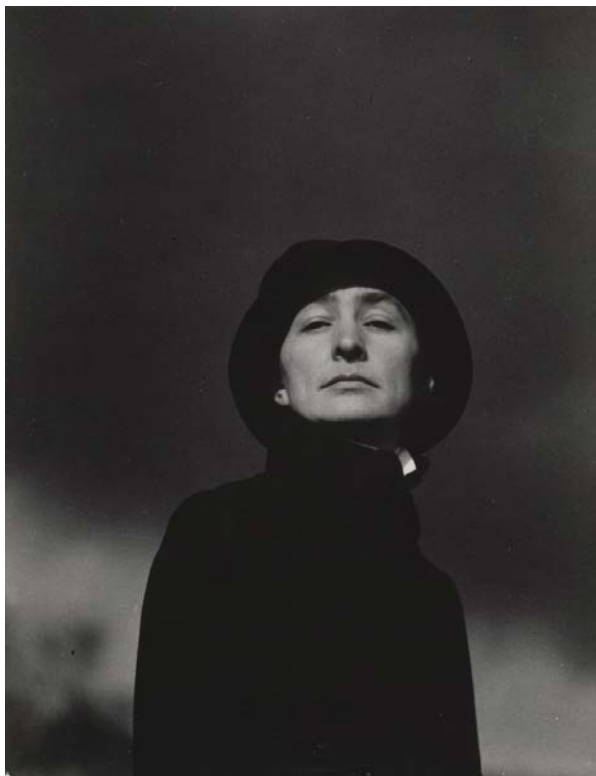
Alfred Steiglitz, Georgia O'Keefe , 1923, Museum of Modern Art, New York