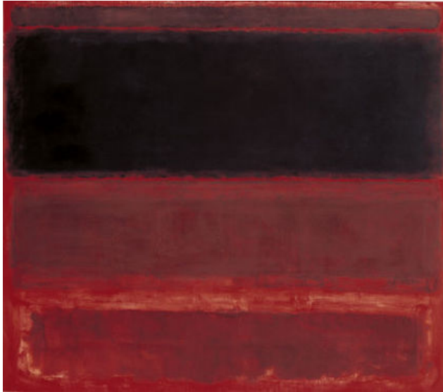
Mark Rothko, Four Darks in Red , 1958, Whitney Museum of American Art