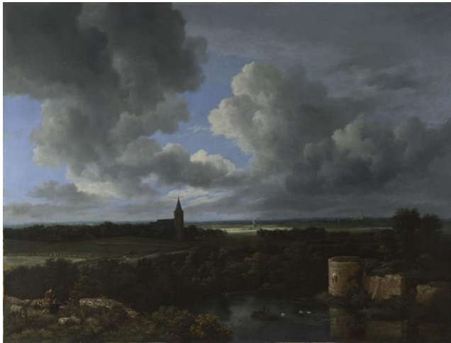
Jacob van Ruisdael, A Landscape with a Ruined Castle and a Church , 1665-70, National Gallery (UK)

1. Welche Merkmale der Landschaft stechen in diesem Bild hervor?