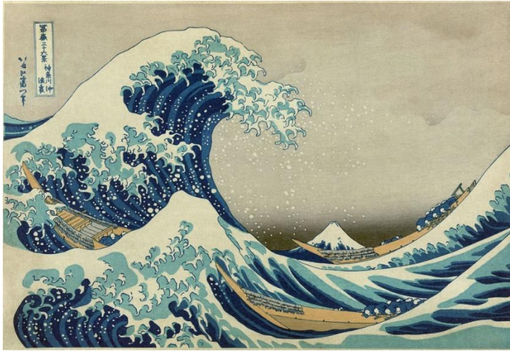
Hokusai, The Great Wave off Kanagawa , 1830-1833, The Metropolitan Museum of Art

1. Welche Merkmale fallen dir an diesem Holzschnitt auf?