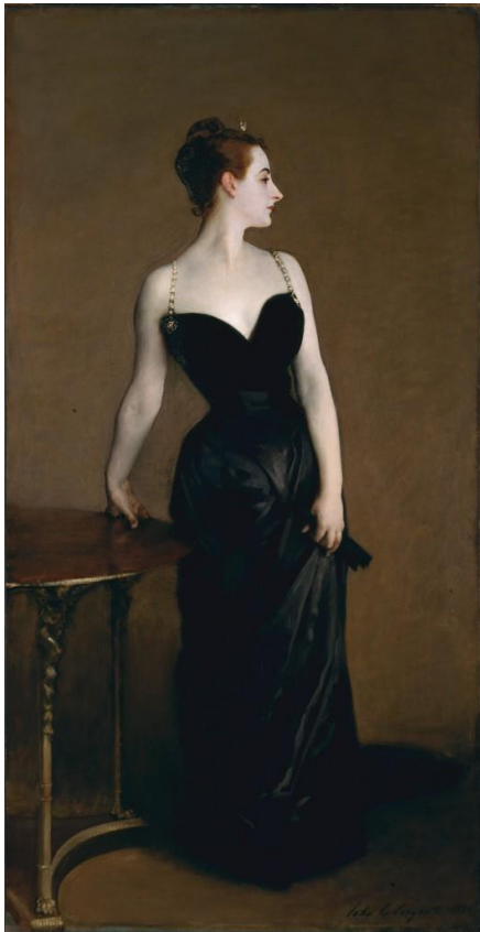
John Singer Sargent, Portrait of Madame X , 1884, The Metropolitan Museum of Art