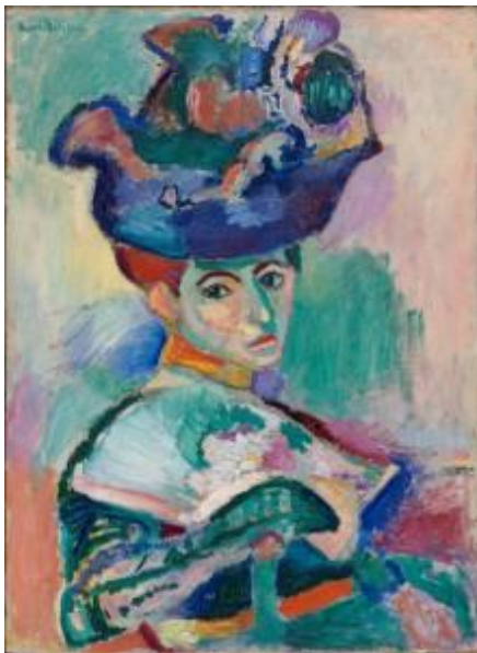
Henri Matisse, Woman with Hat , 1905, San Francisco Museum of Modern Art