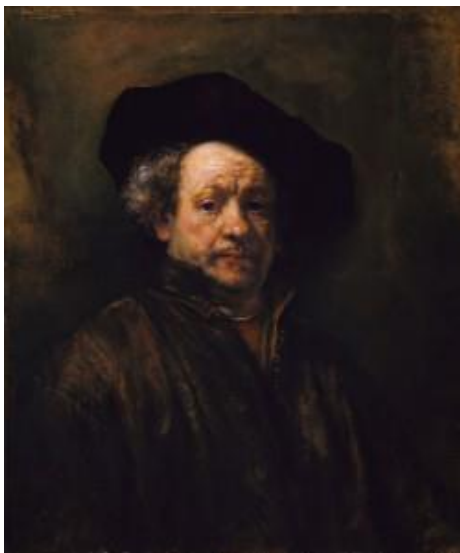
Rembrandt van Rijn, Self Portrait , 1660, The Metropolitan Museum of Art