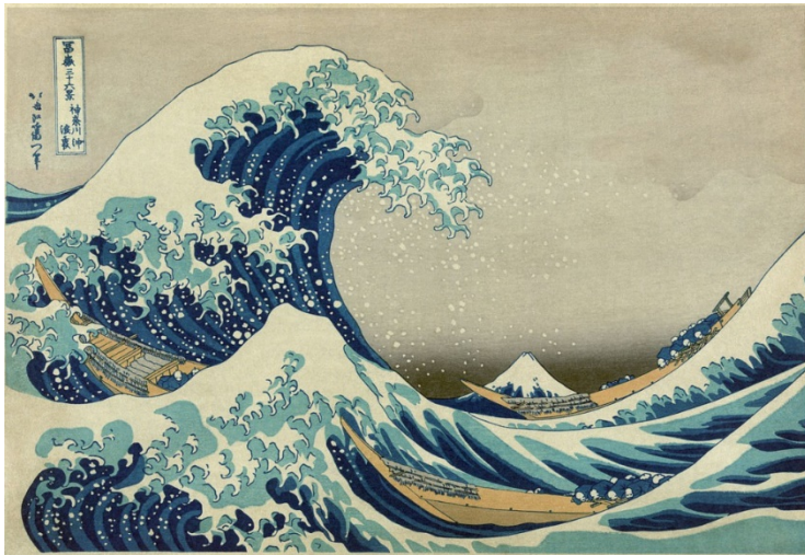
Hokusai, The Great Wave off Kanagawa , 1830-1833, The Metropolitan Museum of Art